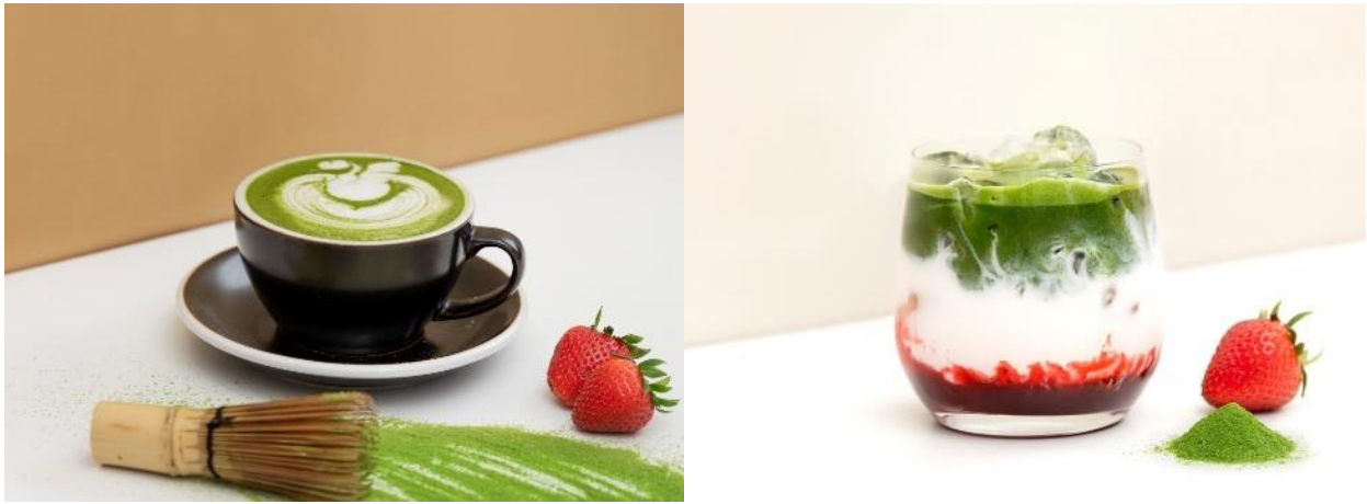
圖片說明 (三)：抹茶拿鐵和草莓抹茶拿鐵使用日本丸久小山園抹茶粉。醇濃的丸久小山園抹茶，融合一絲絲海藻及碳燒香氣，讓人味蕾享受。新鮮草莓更為抹茶拿鐵注入柔和色彩，提升味道層次。